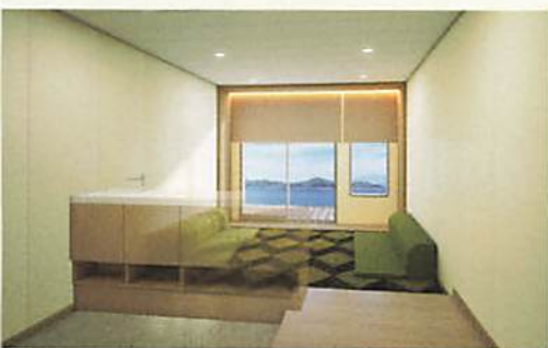
のびのびバルコニー個室