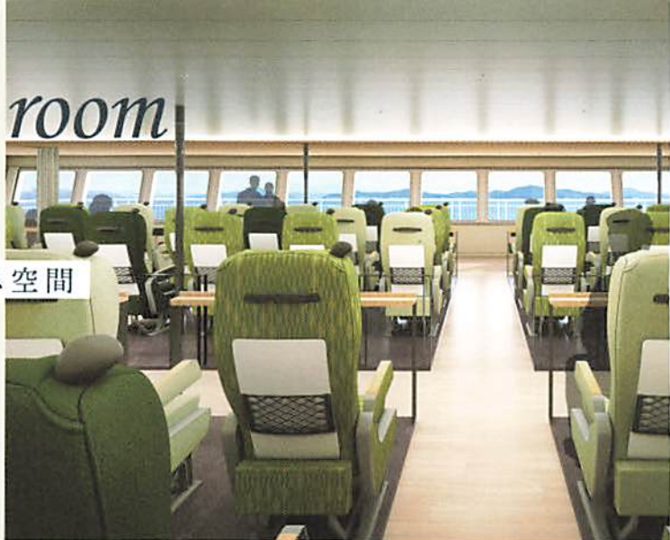
コンフォートリクライニング席(プレミアム席)

客室スペースは、プレミアム席専用エリア・自由席エリア・ベット専用エリア・大型ドライバー専用エリアの4つの区分とし、各エリアごとの入退場を「QRゲート」で管理。