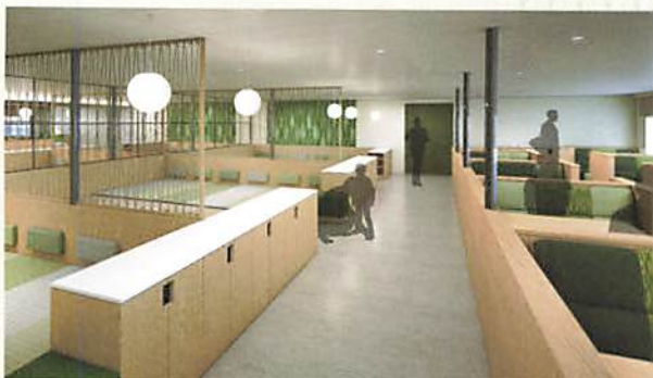
のびのび席/ソファ席

自由席エリアには、グループで楽しく過ごせるソファ席と体を伸ばして休めるのびのび席。昼行便でも、夜行便でも、気の向くままに気軽に瀬戸の船旅を快適にお楽しみいただけます。