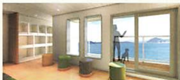
左:ウイズペット個室 右:もふもふラウンジ